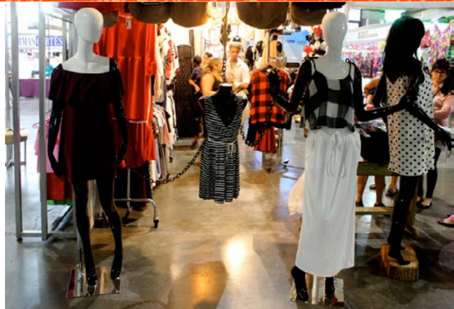
El diseño contemporáneo y la confección artesanal de vestuario juvenil gana espacio en las ferias

En coherencia con la realización de esta feria en la capital en las restantes provincias del país las filiales del FCBC estarán activando todo un sistema de ferias artesanales y otras iniciativas que se insertarán en la propuesta veraniega para la población.